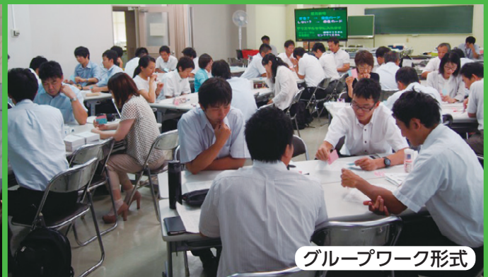
グループワーク形式